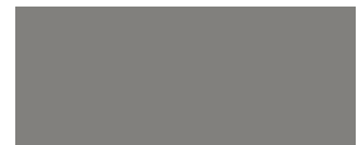
silver 98 (metallic effect)